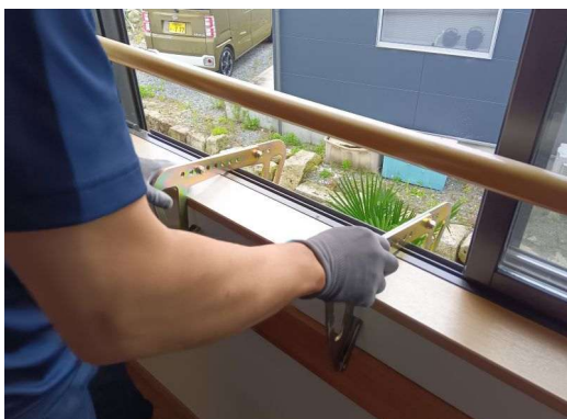
5 * 避難ハシゴ1