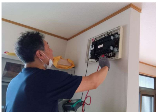
4 * 絶縁の確認