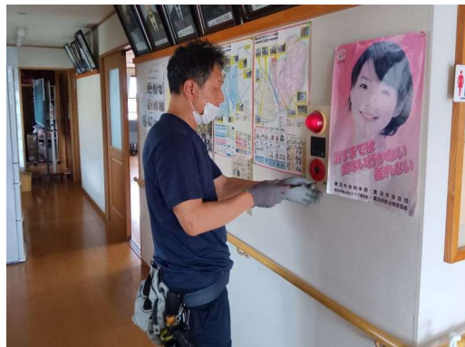
2 * 非常ベルの確認