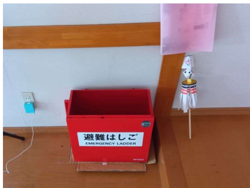
8 * 避難ハシゴ4