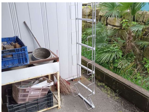
6 * 避難ハシゴ2