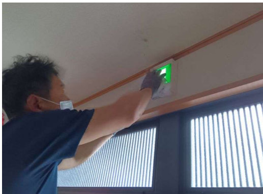
3 * 誘導灯の確認