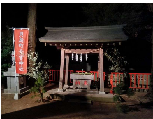
3 手水舎のライトアップ