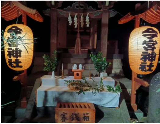
5 本殿とおそなえもの