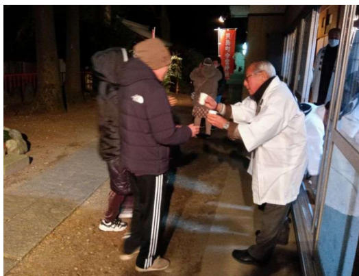
11 甘酒、みかんの進上