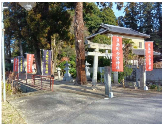
1 貝島今宮神社のぼり設置