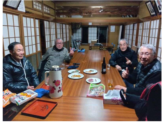
6 待機中の氏子総代の方々