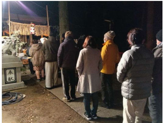
10 整然と並ぶ参拝者達