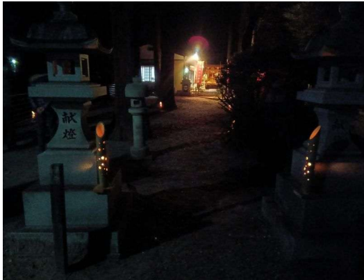
7 竹灯籠と本殿遠景