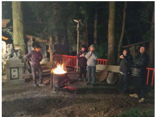
12 焚火のまわりで休憩