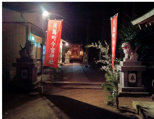
2 夜の貝島今宮神社