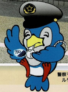
警察マスコット ルリちゃん